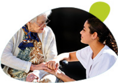
visuel DU psychopathologie de la personne âgée

Le vieillissement démographique impose une adaptation du système de soins aux spécificités des pathologies du grand âge.